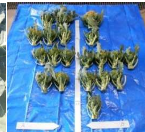
左：かん水区 右：無かん水区