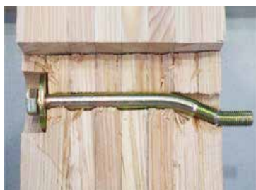
ボルトの曲げ降伏後