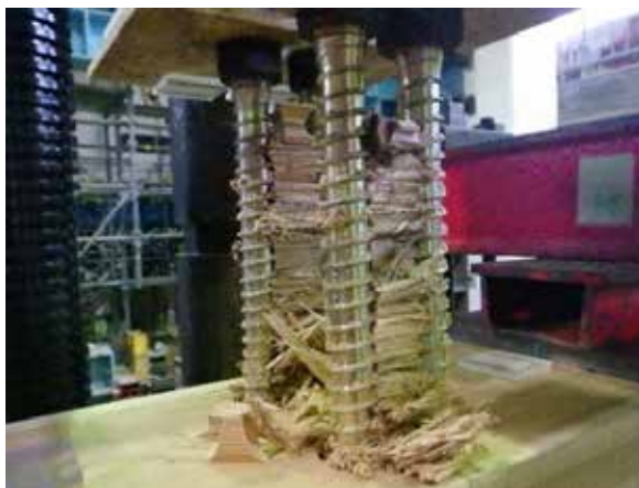
写真 1 LSB 引き抜けによる周辺部材の破壊・ LSB 間部材引き抜け