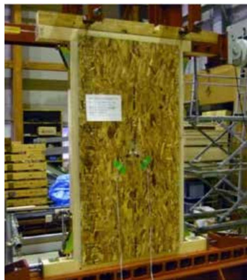
面内せん断試験の概要