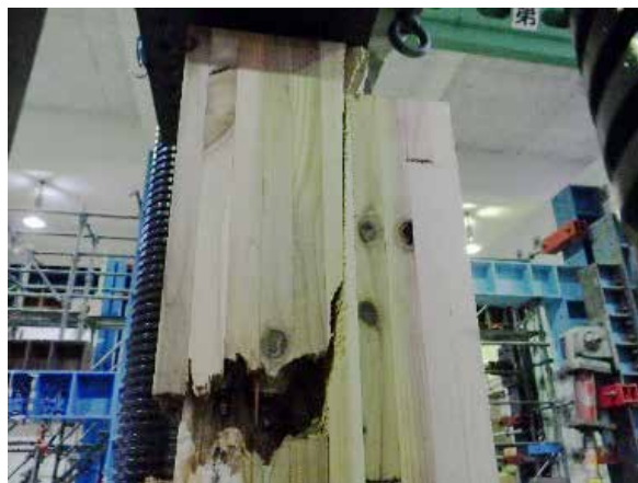
写真 1 GIR 側木材のフィンガージョイント部分の破断