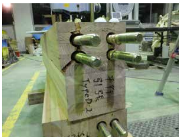
写真 2 LSB 引き抜けによる周辺部材の破壊・ LSB 埋め込み付近の部材割裂破壊