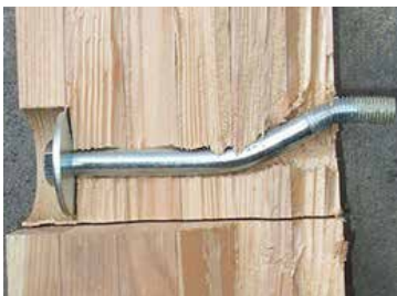
ボルトの曲げ降伏

No.1 は、ボルトの曲げ降伏後に木材が割裂破壊し、その後、ボルトの破断により耐力が低下した。 No.2 は、ボルトの曲げ降伏後に木材の割裂破壊により耐力が低下した。 No.3 は、ボルトの曲げ降伏後にボルトの破断により耐力が低下した。