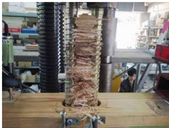
写真 1 LSB 引き抜けによる周辺部材の破壊・ LSB 間部材引き抜け