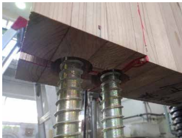
写真 1 LSB 引き抜けによる周辺部材の破壊・ LSB 埋め込み付近の部材割裂破壊