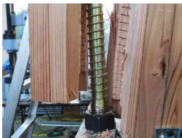
写真 2 内側 LSB の埋め込みに沿った部材の破断