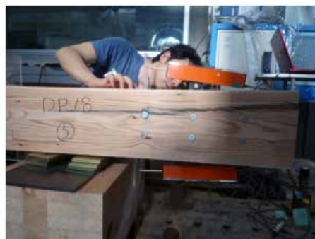
ドリフトピン近傍の割裂破壊