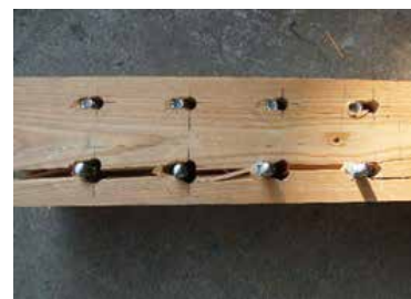
木材の割裂破壊+ボルトの破断