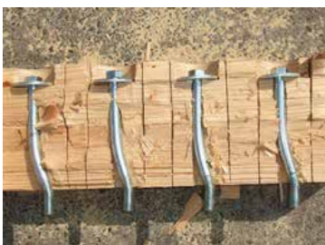
ボルトの曲げ降伏

No.1 は、ボルトの曲げ降伏後に木材の割裂破壊により耐力が低下した。 No.2, No.3 は、ボルトの曲げ降伏後に木材が割裂破壊し、その後、ボルトの破断により耐力が低下した。