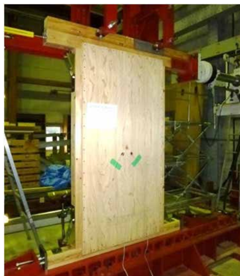
面内せん断試験の概要