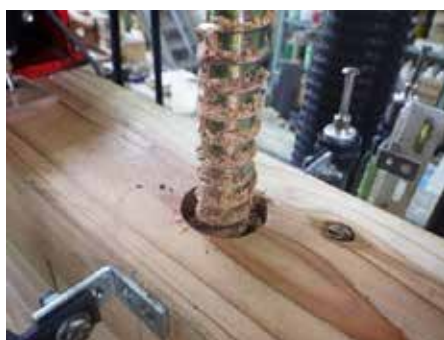
写真 1 LSB 引き抜けによる周辺部材の破壊