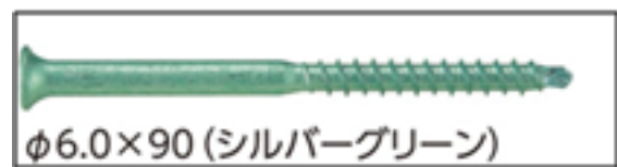
写真3 せん断ビス (YD-R90)