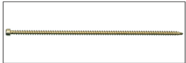
写真2 引張接合用の長ビス (ASSY plus VG)