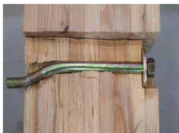
ボルトの曲げ降伏後