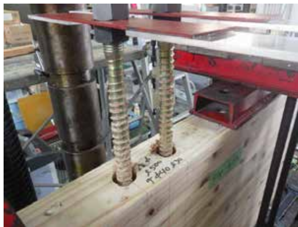
写真 1 LSB 引き抜けによる周辺部材の破壊