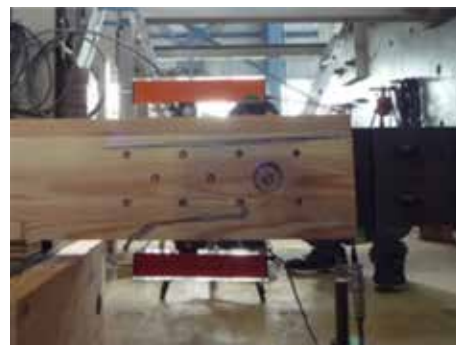
縁寄りのドリフトピン近傍の割裂破壊