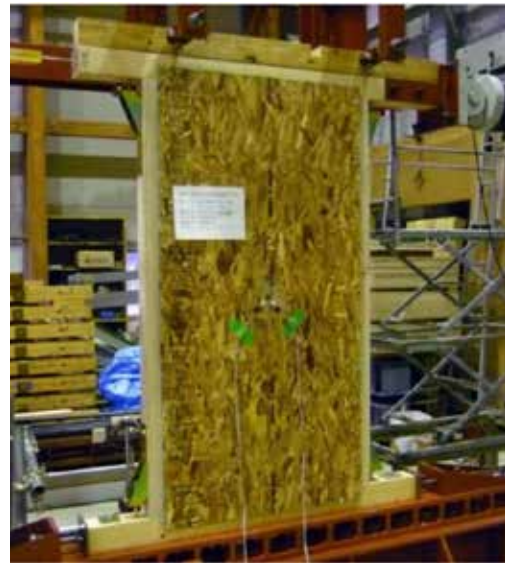
面内せん断試験の概要