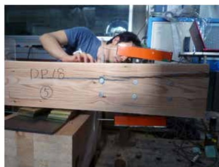
ドリフトピン近傍の割裂破壊