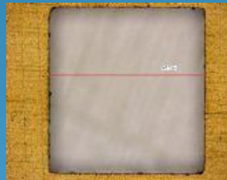
写真⑤ 微細角穴あけ 材質:セラミック基板