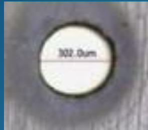
写真① \phi 300\mu\text{m} 穴あけ 材質:金属板