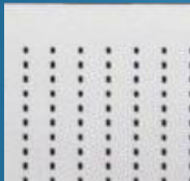
写真④ 微細多数穴あけ 材質:セラミック基板