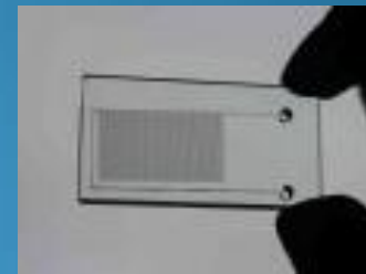
写真⑥ マイクロ流路 材質:ガラス基板