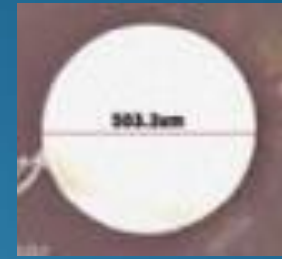
写真③ \phi 300\mu\text{m} 穴あけ 材質:セラミック基板