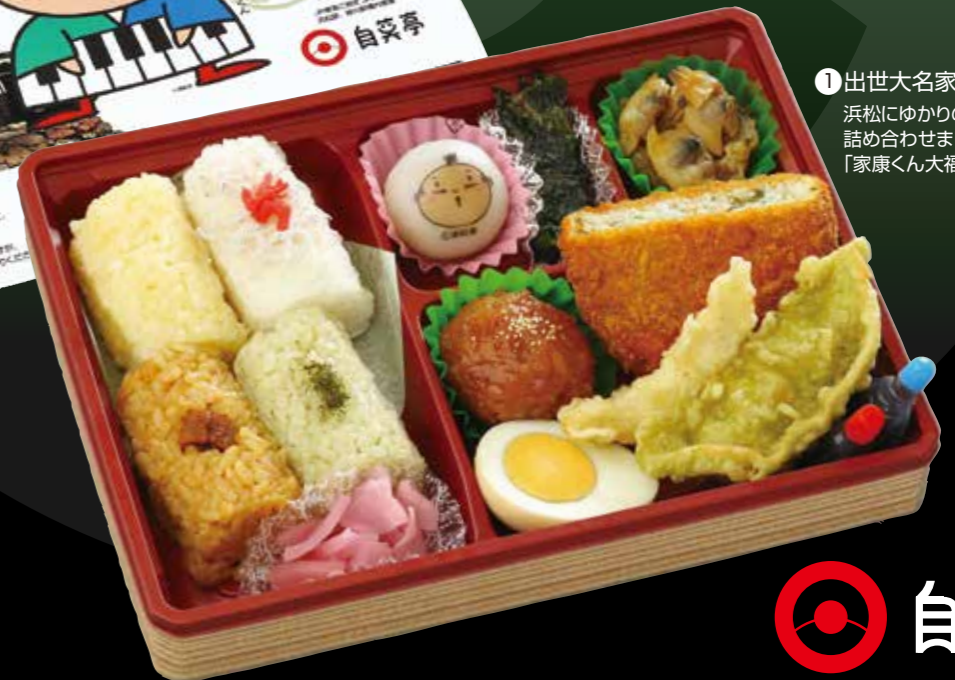
1 出世大名康くん弁当 浜松にゆかりのある食材を詰め合わせました。「家康くん大福」入りです。