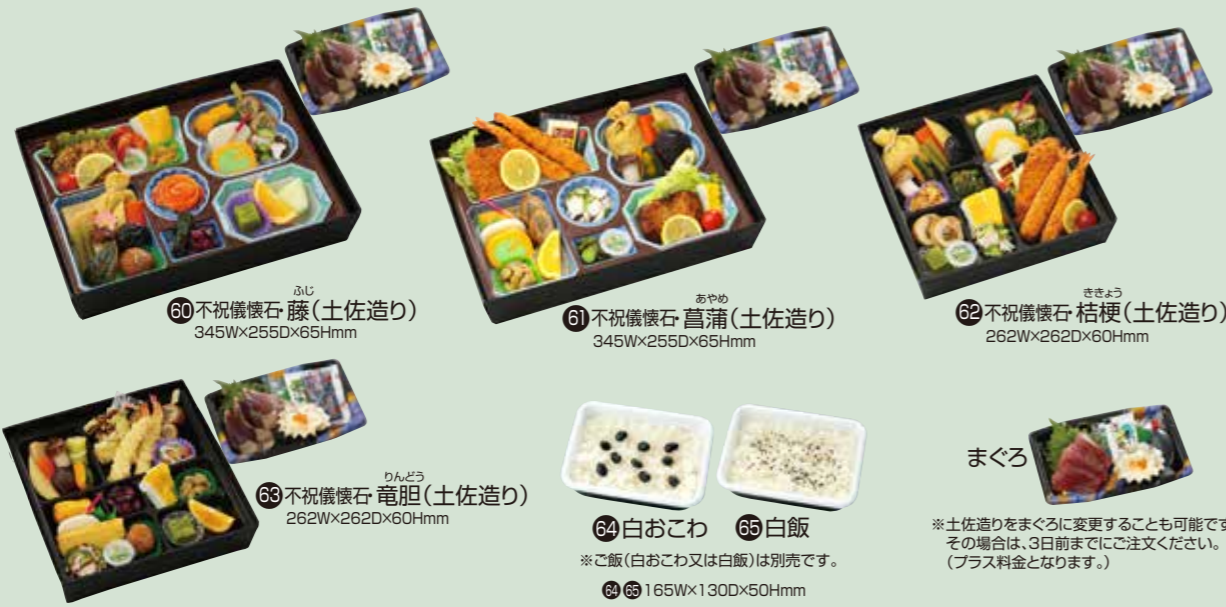
60 不祝儀懐石 藤 (土佐造り) 345W×255D×65Hmm