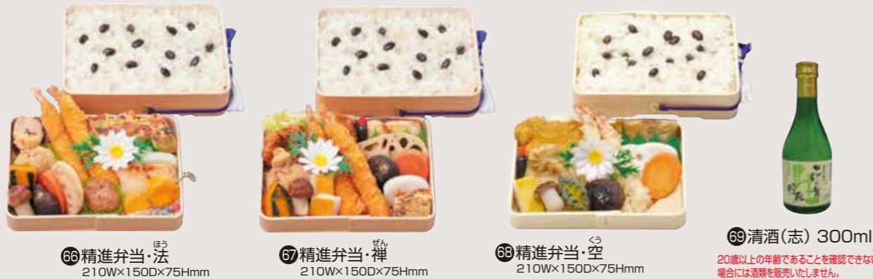
66 精進弁当・法 210W×150D×75Hmm