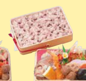
㉓0お赤飯料理・曙(共足) 210W×150D×75Hmm