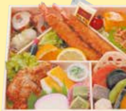
㉓0お料理・松 5個以上で ご注文ください

その他アラカルト 5個以上でご注文ください ㉓1助六寿司 ㉓2お赤飯おにぎり(のりなしパック入) ㉓3直巻きおにぎり(パック入) ㉓42個入りおにぎり(おしんこ付パック入) ㉓5手巻きおにぎり ㉓6～㉓8 おにぎりの具は、梅・鮭・おかつ・昆布より お選び下さい。