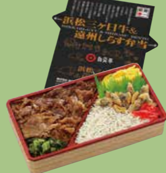
⑨浜松三ヶ日牛&遠州しらす弁当 「三ヶ日牛」と「しらす」の両方が 楽しめる商品です。浜松の駅弁の 人気No.1商品です。