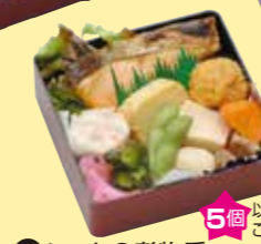
㉔シヤケ&煮物重 5個以上で ご注文ください