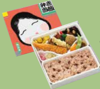
⑩赤飯弁当 もち米100%の 自慢商品です。