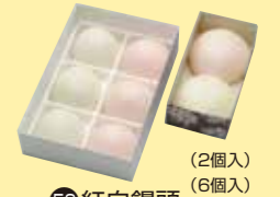
㉓8紅白饅頭 (2個入) (6個入) (9個入) (12個入)