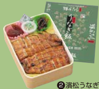
②濱松うなぎ飯 タレを混ぜ込んだご飯の上に 錦糸玉子とうなぎの蒲焼きをのせました。