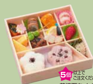
⑮浜松茶寮 茶懐石をイメージした 上品なお弁当です。