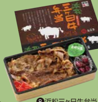
⑧浜松三ヶ日牛弁当 浜松のブランド牛「三ヶ日牛」を 使用したお弁当です。