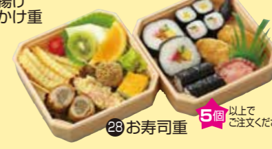
㉘お寿司重 5個以上で ご注文ください