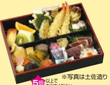
㉙刺身(土佐造り)・天ぷら御膳 5個以上で ご注文ください