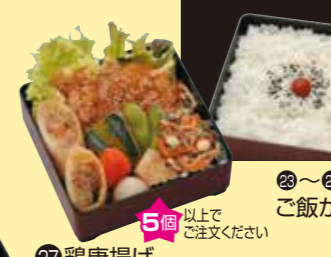
㉖鶏唐揚げ あんかけ重 5個以上で ご注文ください