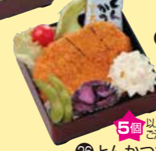
㉗とんかつ重 5個以上で ご注文ください