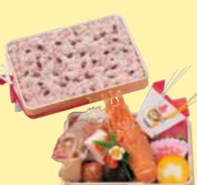
㉓7お赤飯料理・高砂(玉手折) 220W×160D×120Hmm