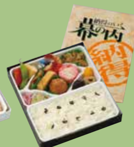
⑪納得のいく幕の内 揚げ物なしのヘルシーで 彩り豊かな幕の内です。