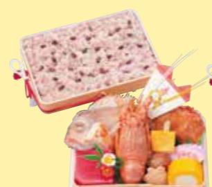
㉓6お赤飯料理・鳳凰(玉手折) 220W×160D×120Hmm