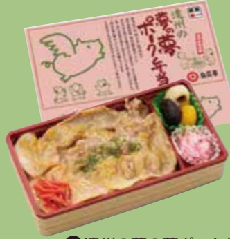
⑦遠州の夢の夢ポーク弁当 酒粕をベースにした特製みそで 焼き上げました。