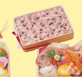
㉓9お赤飯料理・光琳(共足) 210W×150D×75Hmm