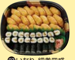
㉓7いなり・細巻皿盛 (いなり20個、細巻24切)