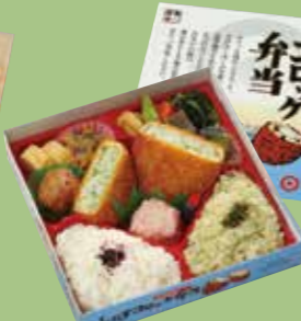
⑫しらすコロッケ弁当 「遠州灘沖のしらす」入りの コロッケがメインのお弁当です。