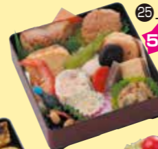
㉕上幕の内重 5個以上で ご注文ください