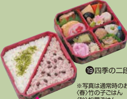
⑲四季の二段重 ※写真は通常時のお料理です。 〈春〉竹の子ごはん 〈秋〉松茸ごはん この時期は、お料理も 写真の内容と異なります。