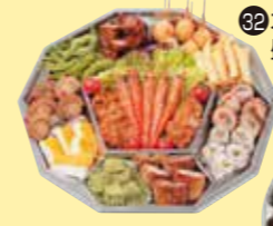
㉓2オードブル 盛り合せ(5人盛)