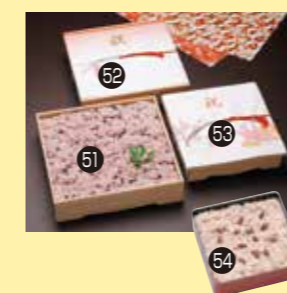
㉓1お赤飯(約2kg) 255W×255D×60Hmm ㉓2お赤飯(約1.5kg) 225W×225D×55Hmm ㉓3お赤飯(約1kg) 200W×200D×50Hmm ㉓4お赤飯(約280g) 140W×140D×45Hmm