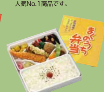
⑭まくのうち弁当 食物繊維たっぷりの まくのうちです。