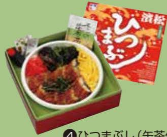
④ひつまぶし(缶茶付) うなぎ飯とうなぎ茶漬の 2つの味が楽しめます。