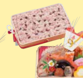
㉓8お赤飯料理・出雲(玉手折) 210W×150D×120Hmm