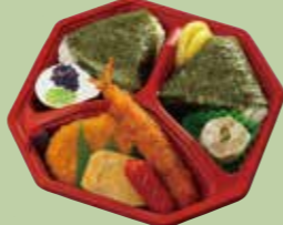
㉒おにぎり弁当 おにぎりの具は、梅・鮭・ おかつ・昆布からお選び下さい。