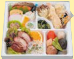
㉓9お料理・竹 5個以上で ご注文ください