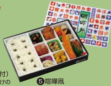
⑤喧嘩風 彩り良く盛りつけられた 豪華版まくのうちです。