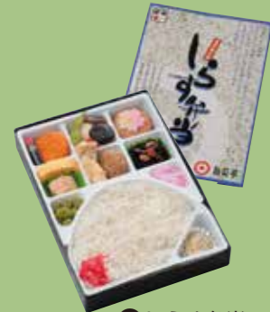
⑥しらす弁当 遠州灘沖でとれたカルシウム たっぷりのしらすをご堪能下さい。