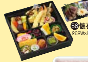
㉓6懐石料理(土佐造り) 262W×262D×60Hmm