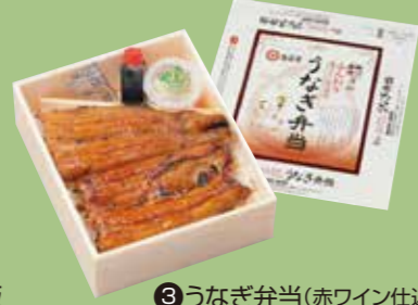
③うなぎ弁当(赤ワイン仕込) 赤ワインに漬けて焼いた うなぎをお楽しみください。