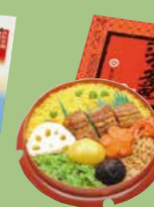
⑬浜の釜めし 五目ごはんは玉子・鶏そぼろ・ うなぎなどの具がきれいに並んでいます。