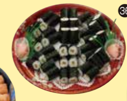
㉓6細巻(かんぴょう) 皿盛(40切)