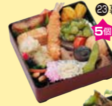
㉓幕の内重 5個以上で ご注文ください