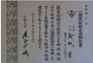
厚生労働大臣、認定 時計一級時計修理技能合格証書