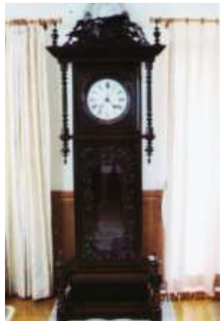
コムワーズ資料館大時計