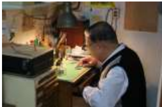
修理機と修理作業の様子です。