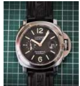
パネライルミノール