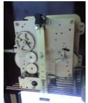
ウエストミスターチャイム ドイツ製ムーブメント