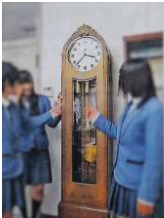
ユンハンス:ホールクロック