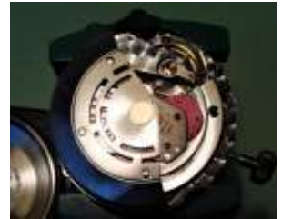
ロレックスのムーブメント