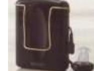
中・高・重度タイプ