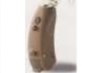
中・高・重度タイプ