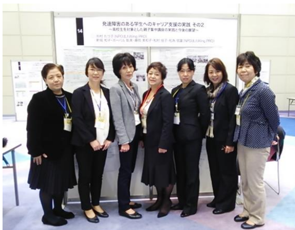
NPO 法人 Wing PRO 理事と教材チーム