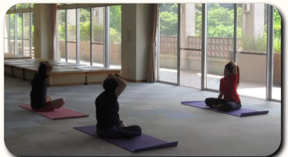
みんなでストレッチグループレッスン中！

「ふれあいラボ」も受付や血圧・体脂肪・体重・握力測定や、トレッドミル、足圧計を使った体操、片足立ちなどの運動プログラムをサポートします。