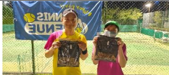
決勝トーナメント