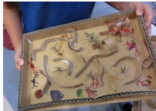
←ファンタスティックに！つくることを愉しみ、 遊びを愉しむ。好奇心の発明だ！