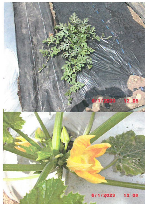
🍈 スクッキー二の花

🍈 スイカの生育状況 ③ ジャガイモ🍠の種芋も移植しました。間もなく収穫の時期を迎えます。「品種はメークインとキタアカリです」