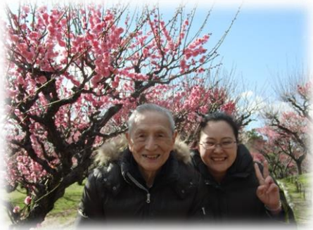
伊丹市、緑ヶ丘公園