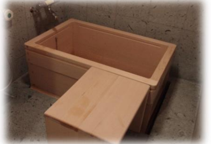
青森ヒバの個浴でほっこりしていただけます。要介護5の方も楽ワザ介護術で安心して入浴できます。