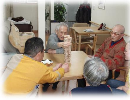
ジェンガで盛り上がっています。