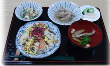
ひな祭りの日の昼食です。