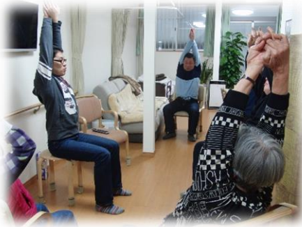
毎日行っている体操の様子です。