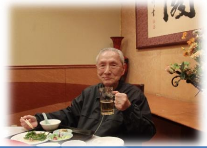
利用者様の思い出の中華料理屋さん、行きたいと思う所に行けるデイにしていきたいです。