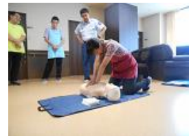
手本を示す消防署員