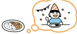
保育園の誕生日会を思い出す