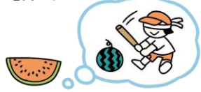
保育園でのすいか割りを思い出す