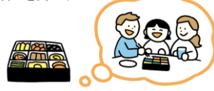
家族で過ごしたお正月を思い出す