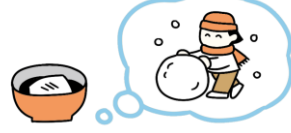
雪遊びを思い出す