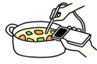
調理時の加熱の徹底(殺菌)