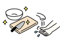
調理室での衛生管理