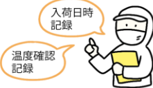
納入業者・食材の品質管理

子どもたちに安全な給食を提供するために、国のガイドラインに沿った衛生管理を行っています。各工程で、決められた内容を実施し、記録しながら作業を行うことで安全性を高めています。