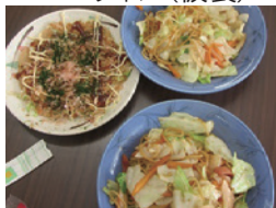
調理実習(やきそば等)