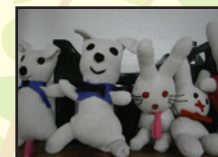
創作活動 (手袋人形制作)