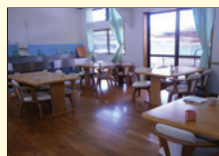
食堂兼作業ルーム