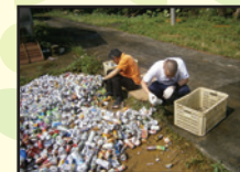
空き缶収集・分別作業