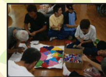
創作活動 (壁画制作)