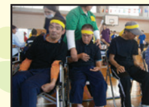
福祉スポーツ大会