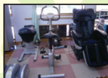
健康作りスペース