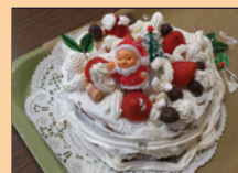
クリスマス会での ケーキ作り