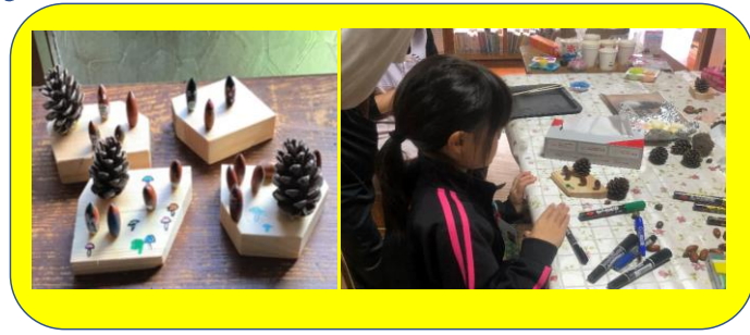
どんぐりトトロの製作