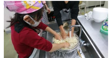
冷たい水でうどんを洗います

10月のハラクッチーは、1回目は手打ちうどん作り。手打ちなのに足で一生懸命にうどんの生地をこねて腰のあるうどんができました。けんちんうどんにして食べました。2回目はリクエストにこたえてオムライス作り。玉ねぎと生ハムをきざんでケチャップライスを作り、トロトロのオムレツをのせて美味しいオムライスができあがりました。