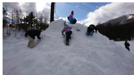
雪遊びは楽しいよ