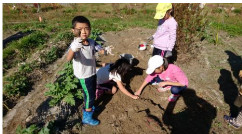
青い空の畑で芋ほり体験

11月7日（土）の森のようちえんでは、芋ほりと焼き芋作り体験を実施します。他に、森の探検・ブランコ・木登りなども行います。小学生以下ならだれでも参加できます。大人も参加できます。お気軽にご参加ください。