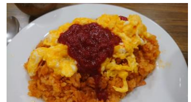
トロトロのオムライスができあがり