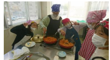
なれた手つきでケチャップライス

11月は毎年恒例の安達そば打ち愛好会の皆さんに教えていただき、美味しいそばを作ります。また、2回目はたこ焼きパーティーを行います。たこ焼き名人も初めての人もぜひご参加ください。