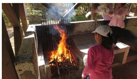
キャンプ場で焼き芋作り