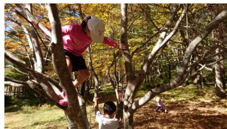
木登りはとても楽しい