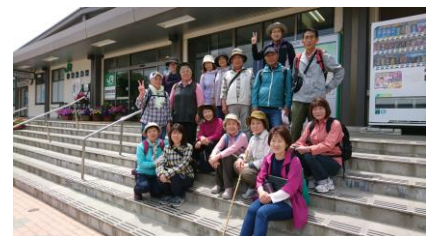
5月磐梯熱海ヶヤキの森ウォーク