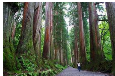
戸隠神社・奥社の杉並木