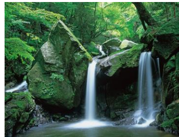
11月矢祭町の滝川溪谷