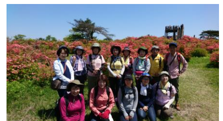
5月の高柴山やまつつじハイク

★詳しくはホームページで、 あだたら青い空 で検索するか、 https://www.adatara-aoisora.com/ NPO法人あだたら青い空 〒964-0074 二本松市岳温泉 2-20-11 電話 0243-24-1518