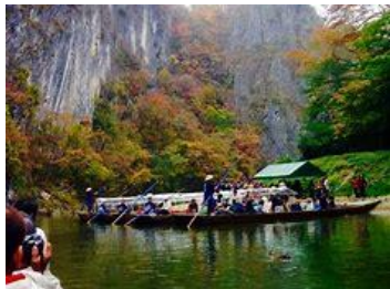
10月 猯鼻溪の川下り