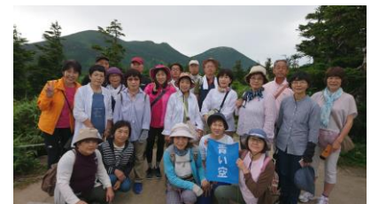
八甲田の高層湿原