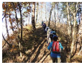
標高626mの天狗山登山