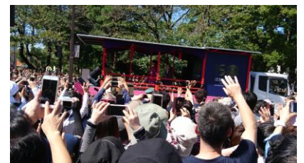
綾瀬はるかさんがゲスト藩公行列