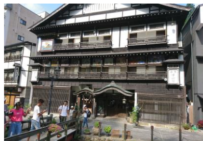
銀山温泉 古山閣に宿泊