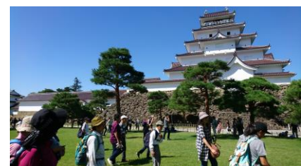
鶴ヶ城本丸での出陣式

★詳しくはホームページで、 あだたら青い空 で検索するか、 https://www.adatarai-aoisora.com/ NPO法人あだたら青い空 〒964-0074 二本松市岳温泉 2-20-11 電話 0243-24-1518