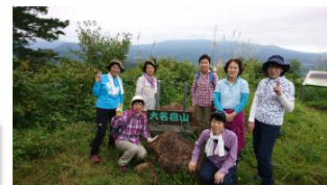
9月の大名倉山ウォーキング

紅葉が始まる10月は2つの紅葉を楽しむ企画。安達太良山の紅葉は山頂から10月初めに始まり中旬に山全体が見ごろを迎えます。また、岩手・狛鼻溪では10月下旬に紅葉の舟下りが楽しめます。皆さんのご参加をお願いいたします。