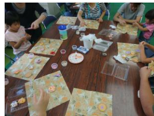
こども食堂でアイシングクッキー

この「こども縁日」に子どもさんだけでなく、大人の皆さんにもご参加いただき、世代間や地域ぐるみの交流の場にしたいと思います。お誘い合わせてご参加ください。