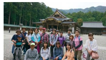
彌彦神社・拝殿にて

9月の「新潟彌彦神社と彌彦山ハイク」には浪江町や飯舘村などから21名が参加。となりの県ですが被災者支援ハイキングとしては初めての新潟ハイクでした。創建2400年、歴史のある彌彦神社は新潟県で一番のパワースポットだそうで、早速ガイドさんの案内で一鳥居からスタート。神様しか渡れない「玉の橋」、重たいと感じたら願いがかなわない「火の玉石」、明治の大火でも焼け残った椎の「御神木」、国の有形文化財の「拝殿」や「狛犬」など。拝殿では珍しい「二礼・四拍・一礼」。ロープウェーで登った彌彦山からは佐渡島や新潟平野の絶景を楽しみ、下山後は日本海の海の幸を堪能して帰ってきました。