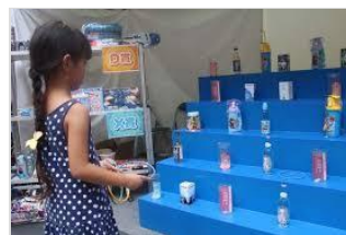
こども縁日はゲームがいっぱい