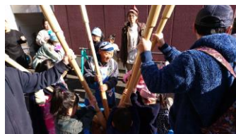
こども食堂でもちつき大会

12月は、こども食堂では毎年恒例となった「もちつき大会」や「クリスマス会」を実施し、ハイキング忘年会では新年の計画作りをしました。2020年も青い空の様々なイベントにご参加ください。