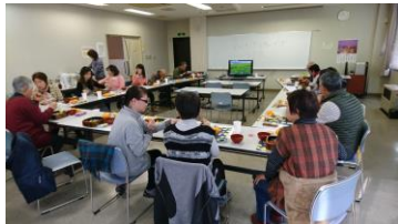
昼食をとりながら交流

1月最初は以前にも実施した「郡山市初詣ハイク」です。開成山大神宮や如宝寺など、郡山の歴史と文化を学ぶハイキング。新年会を兼ねた昼食会も予定。ぜひご参加を!