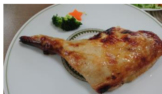
フリースクールでもクリスマス会