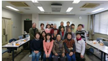
ハイキング＆ウォーキング忘年会

12月恒例のハイキング＆ウォーキング忘年会には浪江町や飯舘村などから20名が参加。2019年のスライドを見た後に1年間を振り返り、「天候に恵まれて良かった」「初めて行くところが多くて楽しかった」「初めて飯舘村のウォーキングは大変だったが実施して良かった」「無理のない計画に満足している」「見学にもっと時間をかけてほしい」「ハイキング講座はとても勉強になった」などの声が寄せられました。また、2020年のハイキングメンバー自身が考えたハイキング計画案は「みんなで話し合って決めていくことはとても良いことだ」という意見がありました。ウォーキングについては二本松市以外の新しいコースを開拓することや、2年目のハイキング講座では「沢登り体験」や「テント泊体験」を実施することなどが話し合われました。その後、お弁当と青い空特製のキノコ汁を食べながら交流しました。お疲れ様でした。