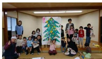
大きなクリスマスツリーが完成