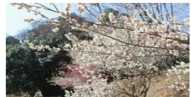
3月 いわきフラワーセンター