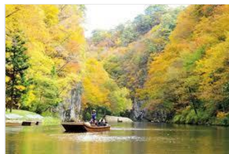
紅葉の狛鼻溪・舟下り