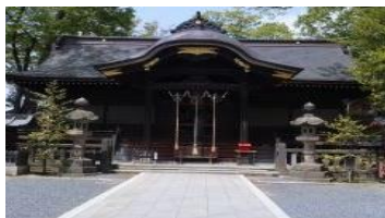
1月 郡山市・安積国造神社