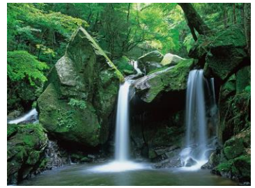
矢祭町・滝川溪谷