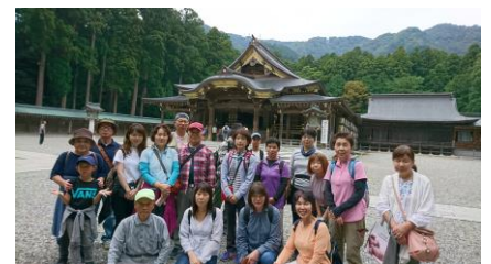
9月の弥彦神社ハイク