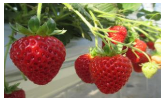
2月 相馬市いちご狩り