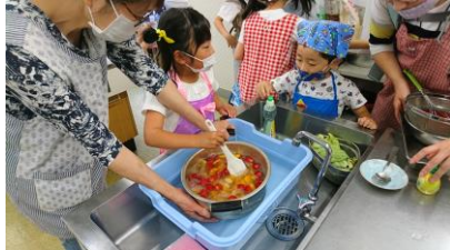
フルーツ寒天作り

6月のハラクッチーは、1回目は焼きそば・ワカメスープ・フルーツ寒天をつくりました。3つのグループに分かれて美味しい焼きそば作りを競いました。フルーツ寒天作りは子どもたちに人気でした。2回目は牛丼・みそ汁・フルーツ白玉をつくりました。白玉は絹ごし豆腐と白玉粉を混ぜて丸めました。子どもたちは上手に白玉を丸めていました。