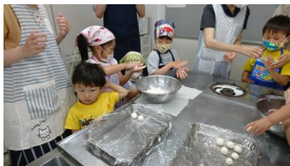
フルーツ白玉作り