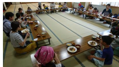
みんなで美味しく食べました