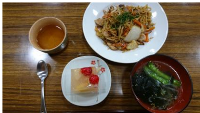
美味しい焼きそばができあがり