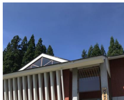
河井継之助記念館

◆参加費 正会員 2000円 賛助会員 2200円 その他 2500円 (子どもは半額)