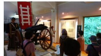
河井継之助記念館での見学