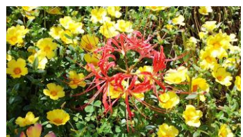
9月はマンジュシャゲウォーク