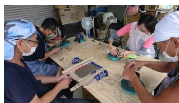
エール「大堀相馬焼き体験」