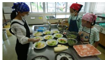
そうめんにとッピング