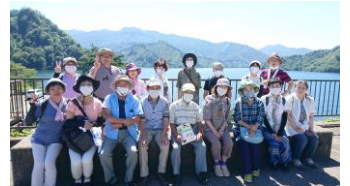
只見町・田子倉ダムにて

来年2022年、河井継之助を描いた司馬遼太郎の小説『峠』をもとにした映画『峠 最後のサムライ』が公開されますが、とても楽しみです。