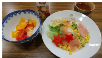
涼しげなそうめん