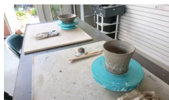
立派なマグカップができました