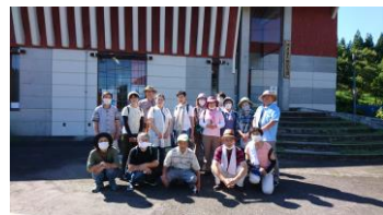
河井継之助記念館にて