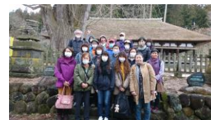
会津・新宮熊野神社前にて