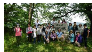
川俣町「エール」ウォーク