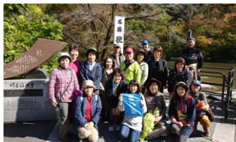
錦秋の狛鼻溪を堪能