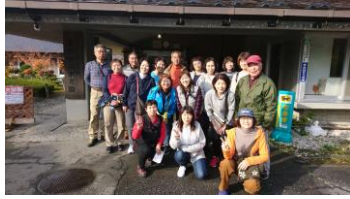
曲り家に宿泊・水光園