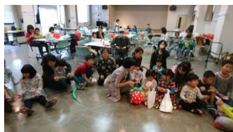
こども縁日でビンゴ大会

このたびの台風 19 号で犠牲になった方や被災者された方にお悔みとお見舞いを申し上げます。青い空に関わる方も被災されています。くれぐれもお体をご自愛いただきながら復旧をすすめていただきたいと思います。