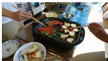
フリースクールでチーズホンデユ

10 月の青い空は、青い空の活動をすすめることが台風災害への支援にもつながるとして諸活動をすすめました。こども食堂ハラクチャーと子どもの居場所作りの活動を共同して、台風直後ではありましたが、子ども自身による初めての「こども縁日」を開催し 90 名の親子連れやボランティアさんに集まっていただきました。輪投げ・射的・魚釣りなどの手作りゲームや、コカリナ演奏やバルーンアートなどの体験、3 種類の軍艦巻き作り、ビンゴ大会など子どもたちのたくさんの笑顔を見られる催しとなりました。多くの皆様のご協力で成功させることができ、本当にありがとうございました。これからも、子どもが自分たちで企画・実行するものを見つけていきたいと思えます。岩手ハイクも、台風などの影響もありましたが、被災地同士が交流し合いながら無事に実施することができました。