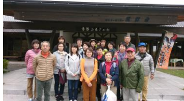
遠野・ふるさと村