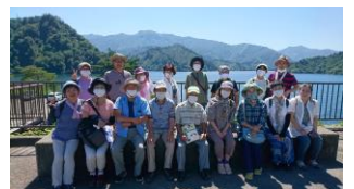
只見町自然と歴史ハイク