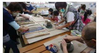
8月エール・大堀相馬焼き