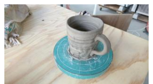
きれいなマグカップが