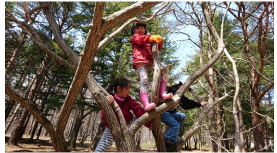
木登り・ブランコ・秘密基地づくりなど

森のようちえんとは、子どもが森や川などの大自然の中で自由に遊ぶことによって、豊かな感性や創造力などの人間が本来持っている能力を引き出す取り組みです。