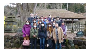
会津・新宮熊野神社にて